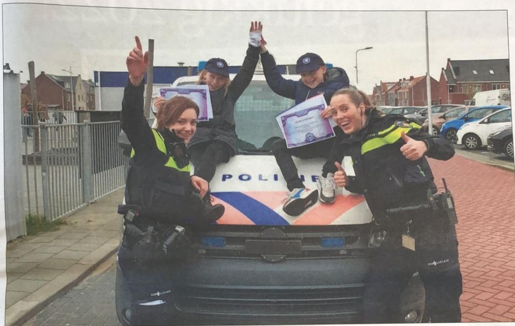
De 'Hackshieldpromotors' feliciteren de winnaars van 't Reigerbos op de locatie Koningskwartier.