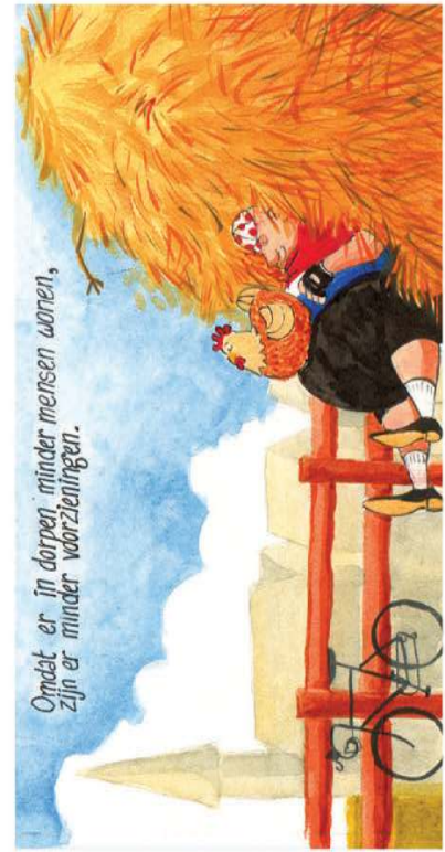
Omdat er in dorpen minder mensen wonen, zijn er minder voorzieningen.