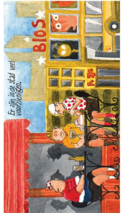
Er zijn in de stad veel voorzieningen.