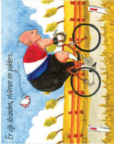
Er zijn stranden, rivieren en polders.