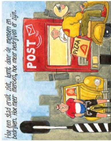
Hoe een stad eruit ziet, komt door de mensen en bedrijven. Hoe meer mensen, hoe meer bedrijven er zijn.