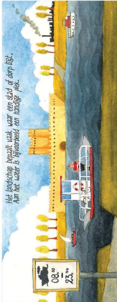
Het landschap bepaalt vaak waar een stad of dorp ligt. Aan het water is bijvoorbeeld een handige plek.